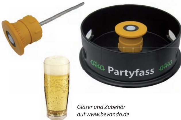
Gläser und Zubehör auf www.bevando.de